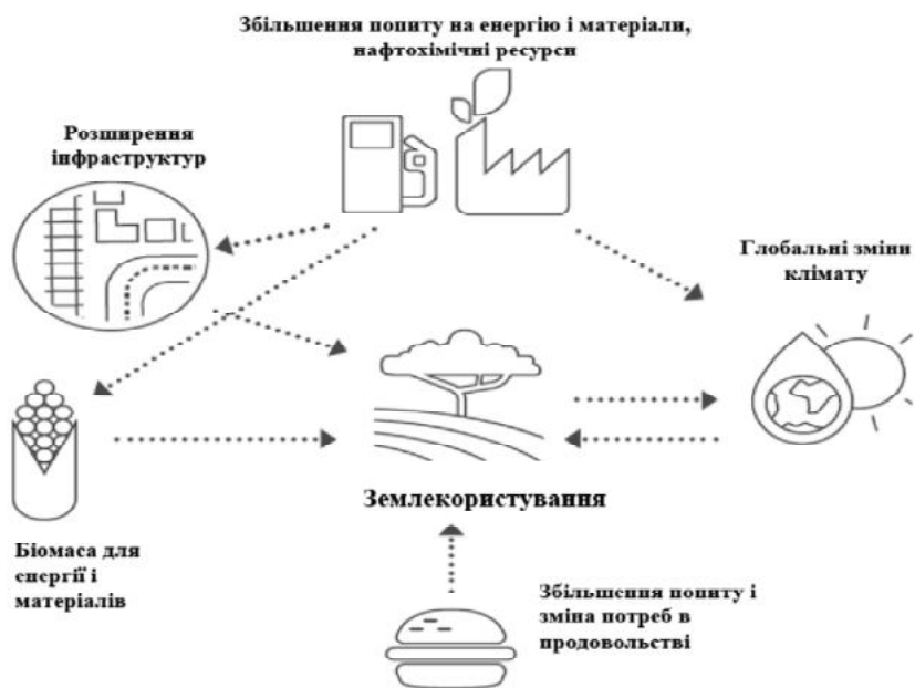
Рис. 2. Логічно-змістовна схема нової конкуренції за землю, взаємодії і зворотнього зв'язку.

Розглянемо конкуруючі типи землекористування, як складові нетрадиційного землекористування. До них нами віднесено: органічне землеробство, біодинамічне землеробство, точне землеробство, екологічно чисте землеробство, землеробство з вирощування нішових культур [27]. Враховуючи, що органічне землеробство та вирощування нішових культур має найкращі тенденції розвитку у світі і в Україні, розглянемо їх більш детально. Так, у світі спостерігається позитивна тенденція збільшення площ сільськогосподарських угідь із виробництва органічних продуктів. Так загальна площа сільськогосподарських угідь у світі із виробництва органічної продукції зросла із 30,2 млн га в 2006 р. до 72,3 млн га у 2019 р., або на 58% [28]. Приріст площ сільськогосподарських