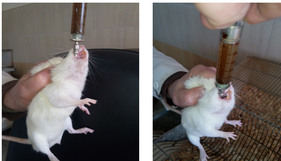
Рис. 1. Дослідження гострої токсичності кормової добавки з прісноводної водорості Lemna minor збагаченої Йодом на лабораторних щурах.

Принцип методу визначення класу токсичності полягає у використанні 3-х тварин однієї статі на кожному етапі та заснований на біометричному оцінюванні з фіксованими дозами, які розподілені за часом прийому так, щоб було можливо оцінити добавку за ступенем небезпеки і систематизувати результати. Рівень початкової дози має з найбільшою вірогідністю зумовлювати часткову загибель тварин, яким задавали одну із чотирьох фіксованих доз (5, 50, 300 та 2000 мг/кг маси тіла).