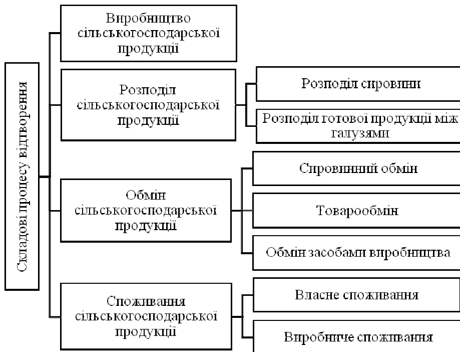
Рис. 1. Складові процеси відтворення сільськогосподарського виробництва. Складено автором із використанням [6]

Історичним прикладом «збою» процесів відтворення у сільському господарстві можна назвати спад економіки США під час Великої депресії. Для подолання кризових явищ та нормалізації процесів відтворення у сільському господарстві тоді був прийнятий закон про регулювання сільського господарства, метою якого було гарантувати на рівні уряду кредиторам повернення фермерами заборгованості і збільшити фермерський дохід шляхом підняття цін на сільськогосподарську продукцію [9].