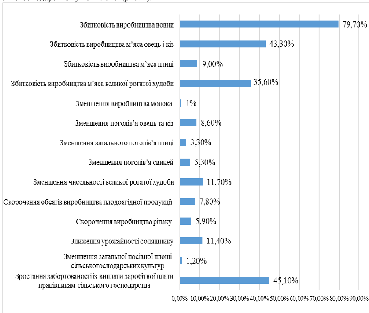
Рис. 4. Проблемні аспекти відтворення у сільському господарстві України (2014 р. до 2013 р.)

Дані, що оприлюднює Державна служба статистики України, дозволяють ідентифікувати ряд особливо проблемних аспектів, характерних нині для процесів відтворення у вітчизняному сільськогосподарському комплексі (рис. 4).