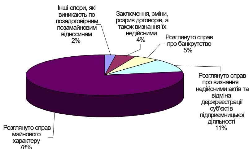
Рисуюнок 1. Структура вирішених справ арбітражними судами протягом 2005 року

Крім того, чимало державних підприємств ще продовжують перебувати у стані досудової санації, яка регламентується постановою Кабінету Міністрів № 515 від 17.03.2000. Загалом база даних Агентства з питань банкрутства містить інформацію щодо понад 14 тис. потенційних банкрутів, відповідні справи щодо яких ще не розпочато. Але у порівнянні із загальною кількістю неплатоспроможних підприємств це незначна цифра. Так, лише в аграрно-промисловому комплексі кількість таких підприємств становить близько 10 тисяч.