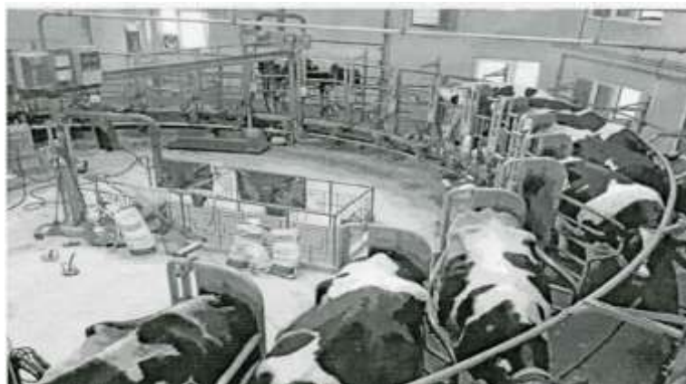
Рис. 1 Доїльна установка типу «Карусель» зі станками типу «Ялинка»

установку типу «Паралель» до станка одночасно заходить 16 корів, які обслуговують два оператори. Підготовка корів до доїння здійснюється за наступною схемою: механізоване обмивання вимені теплою водою, витиранням одноразовою серветкою, здоювання перших цівок молока і підключення доїльних апаратів. Кожний оператор обслуговує одночасно 8 корів. Доїльна установка «Карусель» має 32 станки, в яких корови розміщуються за схемою «Ялинка». Установку одночасно обслуговує три оператори машинного доїння за наступною схемою: перший оператор витирає вим'я спочатку вологими, а потім сухими серветками, здійснює здоювання перших цівок молока та проводить дезінфекцію дійок спеціальним розчином. Другий – підключає доїльний апарат до підготовленої корови та контролює процес доїння, а третій виконує заключні операції доїння та управляє швидкістю руху доїльної платформи.