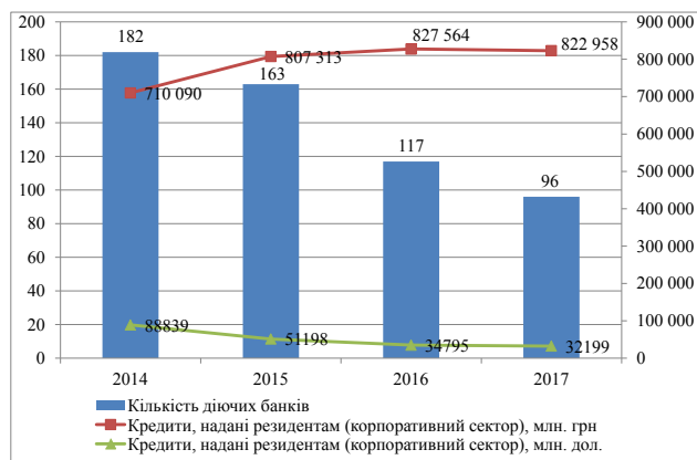
Рис. 2. Основні показники кредитного портфеля комерційних банків України в 2014–2017 рр.

З огляду на значні обсяги докапіталізації низки банківських установ та виключення з порядку розрахунку статистичних показників НБУ банків, що визнано неплатоспроможними,