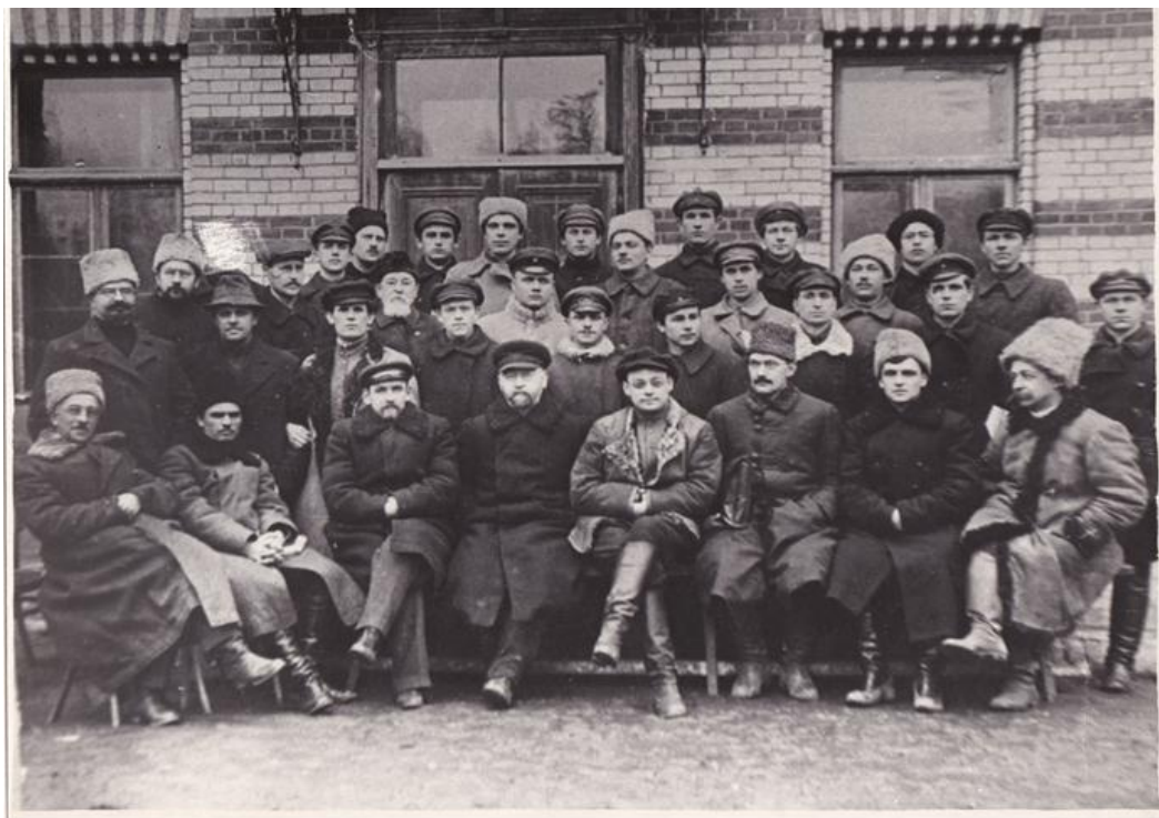
Перший випуск Маслівського аграрного закладу, 1925 р. Майже всі студенти цього випуску спочатку навчались у Маслівській суспільній гімназії