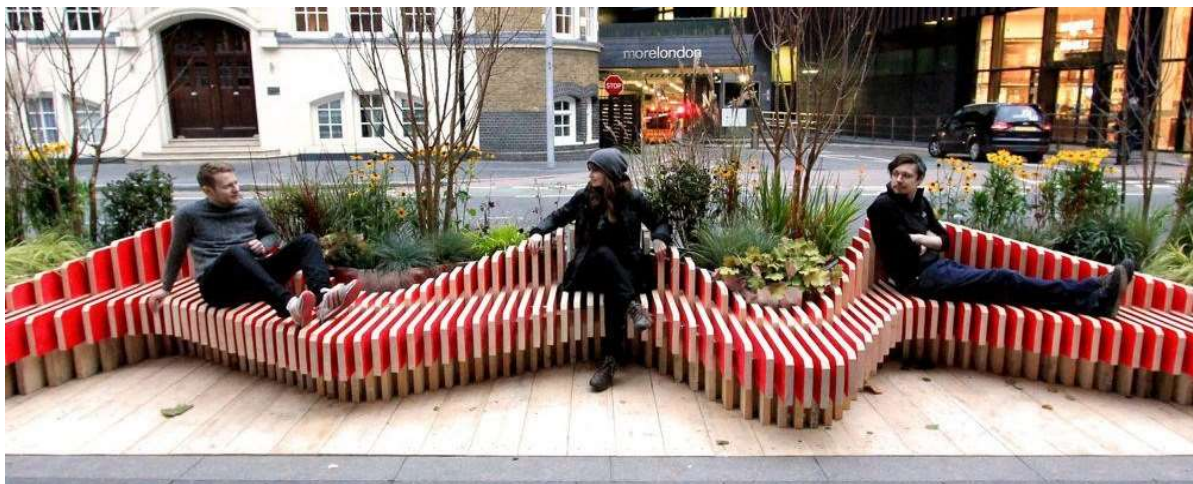
Рис.2. Лондон, дизайнери ParkedBench зі студії WMB відпочивають на парклеті.

Лондон відомий своїми чудовими міськими парками, але і в цьому місті також активно впроваджують невеликі озеленені островці в міське середовище. Одним із відомих прикладів перетворення частини вулиці на мікропарк є встановлений парклет ParkedBench замість двох паркувальних місць на одній із лондонських вулиць. Він являє собою портативний мікропарк, розроблений британськими дизайнерами WMB Studio, який пропонує нове громадське місце, оточене рослинністю. Поєднання зручних лав для сидіння з насадженнями рослин формує буферну зону, що захищає від трафіку транспорту [4].