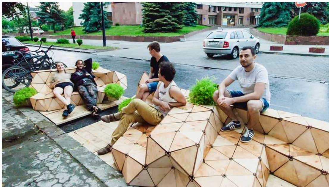
Рис.3. Івано-Франківськ. Перший парклет в Україні.

можна відпочивати, сидячи на підлозі, на лавах і на модулях. Є місце для велопарковки. На вулиці, де було встановлено парклет, раніше не було жодної лави для відпочинку, так що без сумніву цей громадський простір буде користуватися популярністю у мешканців міста [2]. Наразі, такі вуличні меблі з'являються і в інших містах України: в Чернівцях, Дніпрі, Павловську, Хмельницькому та інших.