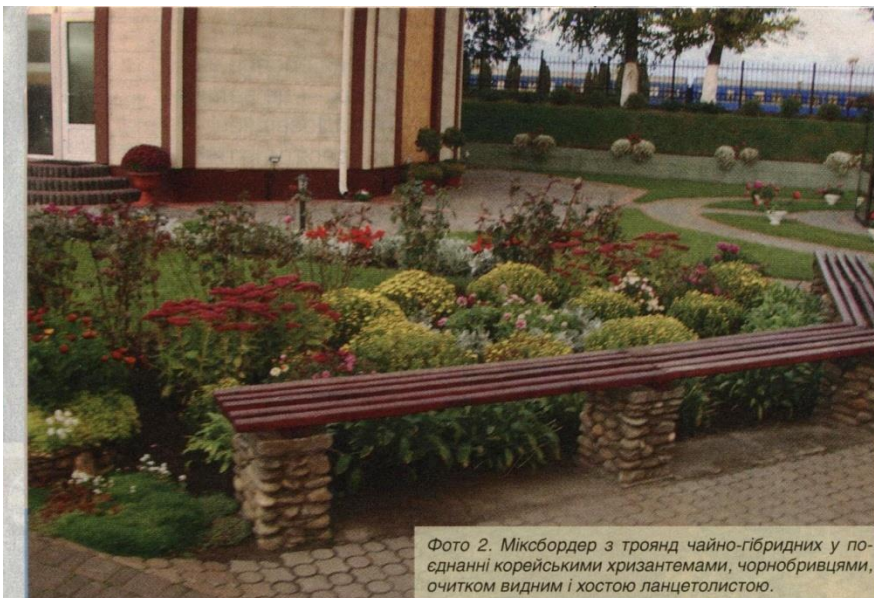
Фото 2. Міксбордер з троянд чайно-гібридних у поєднанні корейськими хризантемами, чорнобривцями, очитком видним і хостою панцетолістою.