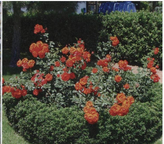
Фото 6. Чайно-гібридні троянди — сусіди самшиту вічнозеленого.

Акцентні рослини — високі рослини, які приваблюють погляд упродовж усього сезону.