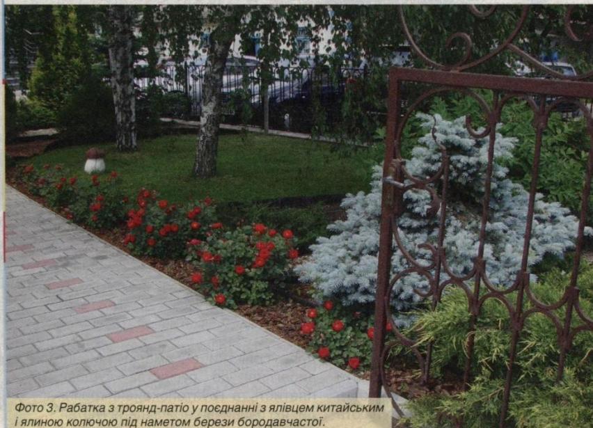
Фото 3. Рабатка з троянд-патио у поєднанні з ялівцем китайським і ялиною колючою під наметом берези бородавчастої.