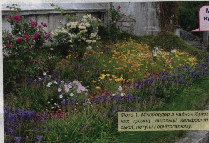
Фото 1. Міксбордер з чайно-гібридних троянд, ешольції каліфорнійської, петунії і орнітогаліуму.

для «солістки ансамблю». Менш вибагливі до сусідства кущові, плетисті та ґрунтопокровні троянди, які зазвичай не «заперечують» проти красивого обрамлення. Тоді як чайно-гібридні, флорибунда й мініатюрні, навпаки, досить вибагливі щодо сусідів і не люблять жити в тісноті.