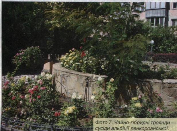
Фото 7. Чайно-гібридні троянди — сусіди альбіції ленкоранської.

садити карликові форми туї та ялівцю. Красивий й довершений вигляд матимуть штамбові троянди в оточенні хвойних рослин (сланкі форми ялівцю або кулясті сорти туї).