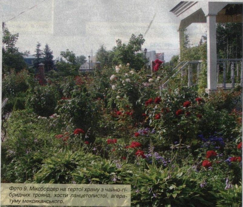
Фото 9. Міксбордер на тертої храму з чайно-гібридних троянд, хости ланцетолістої, агератуму мексиканського.

І головне — вибирати партнерів для троянди треба без фанатизму, створивши відчуття багатства представлених деталей і текстур, і стежити, щоб оточення не затьмарювало королеву вашого саду, а вона обов'язково віддячить ясным і тривалим квітуванням.