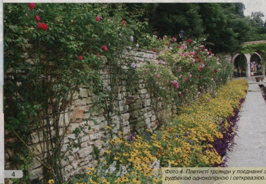
Фото 4. Плетисті троянди у поєднанні з рудбекією одноколірною і сеткреазією.

щувати в палісаднику, біля тераси чи загорожі, по краях газону або вздовж доріжок (фото 3).