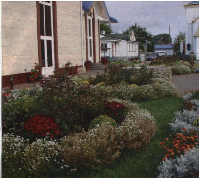
Фото 5. Міксобордер з трояндою чайно-гібридною у центрі і корейською хризантемою та іберисом по периметру.