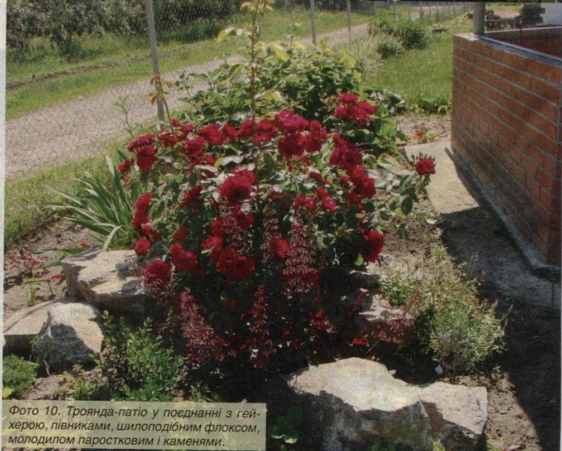
Фото 10. Троянда-патіо у поєднанні з гейхерою, півниками, шилоподібним флоксом, молодилом паростковим і каменями.