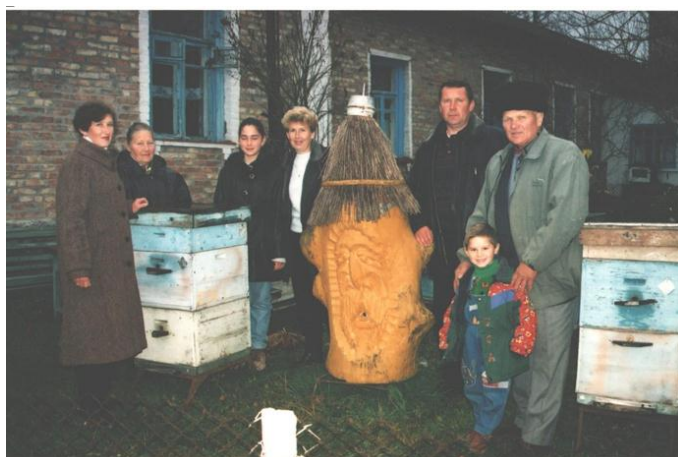
У родинному колі. 2000-ні рр.