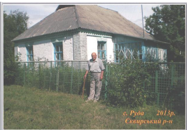
Біля рідної хати. 2013 р.