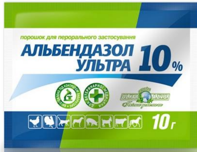
Рисунок 2. Зовнішній вигляд препарату „Альбендазол ультра 10 % порошок”

Тваринам контрольної групи антигельмінтик не призначали. Всі дослідні та контрольні тварини протягом періоду досліджень (30 днів) перебували в аналогічних умовах годівлі й утримання. Після дегельмінтизації за тваринами було встановлено клінічне спостереження. Антигельмінтну ефективність препаратів визначали на 12-й день після останнього їх застосування визначали екстенсефективність (ЕЕ) та інтенсефективність (ІЕ) препаратів.