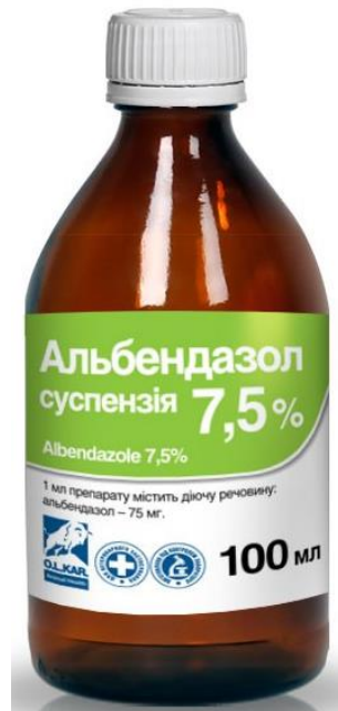
Рисунок 1. Зовнішній вигляд флакона „ Альбендазол 7,5 % суспензія ”

Альбендазол 7,5 % суспензія білого кольору без запаху та смаку. В 1 мл препарату міститься діюча речовина: альбендазол – 75 мг та допоміжні речовини до 1 мл. Діюча речовина препарату – альбендазол – метил [5-(пропілсульфаніл)-1 n -бензімідазол-2-іл] карбамат, належить до групи бензімідазолів. Альбендазол гальмує білковий (тубулярний) синтез, в результаті чого порушується надходження і внутрішньоклітинне транспортування поживних речовин та обмін аденозинтрифосфорної кислоти і глюкози. Знижуються мітохондріальні реакції через гальмування фумаратредуктази, що викликає зменшення кількості глікогену та загибель паразитів від виснаження.