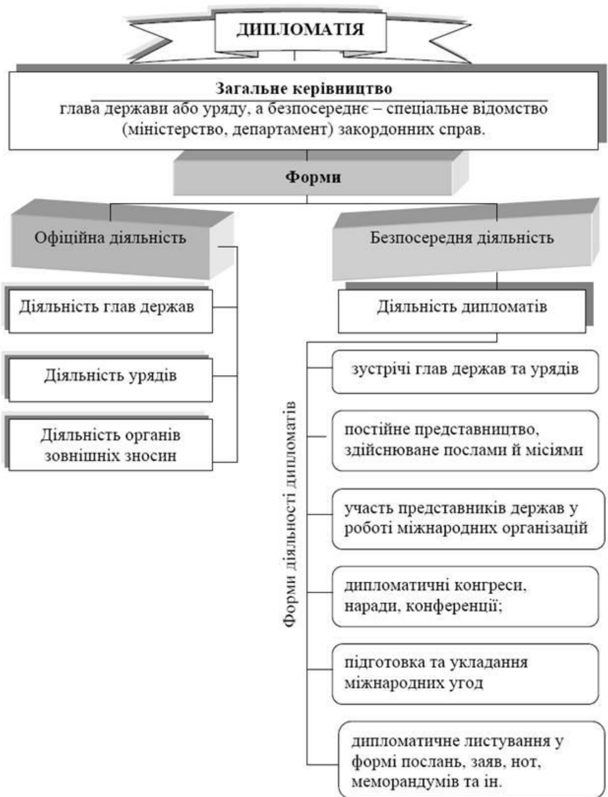
Рис. 1.3 Дипломатія, як спосіб здійснення зовнішньої політики