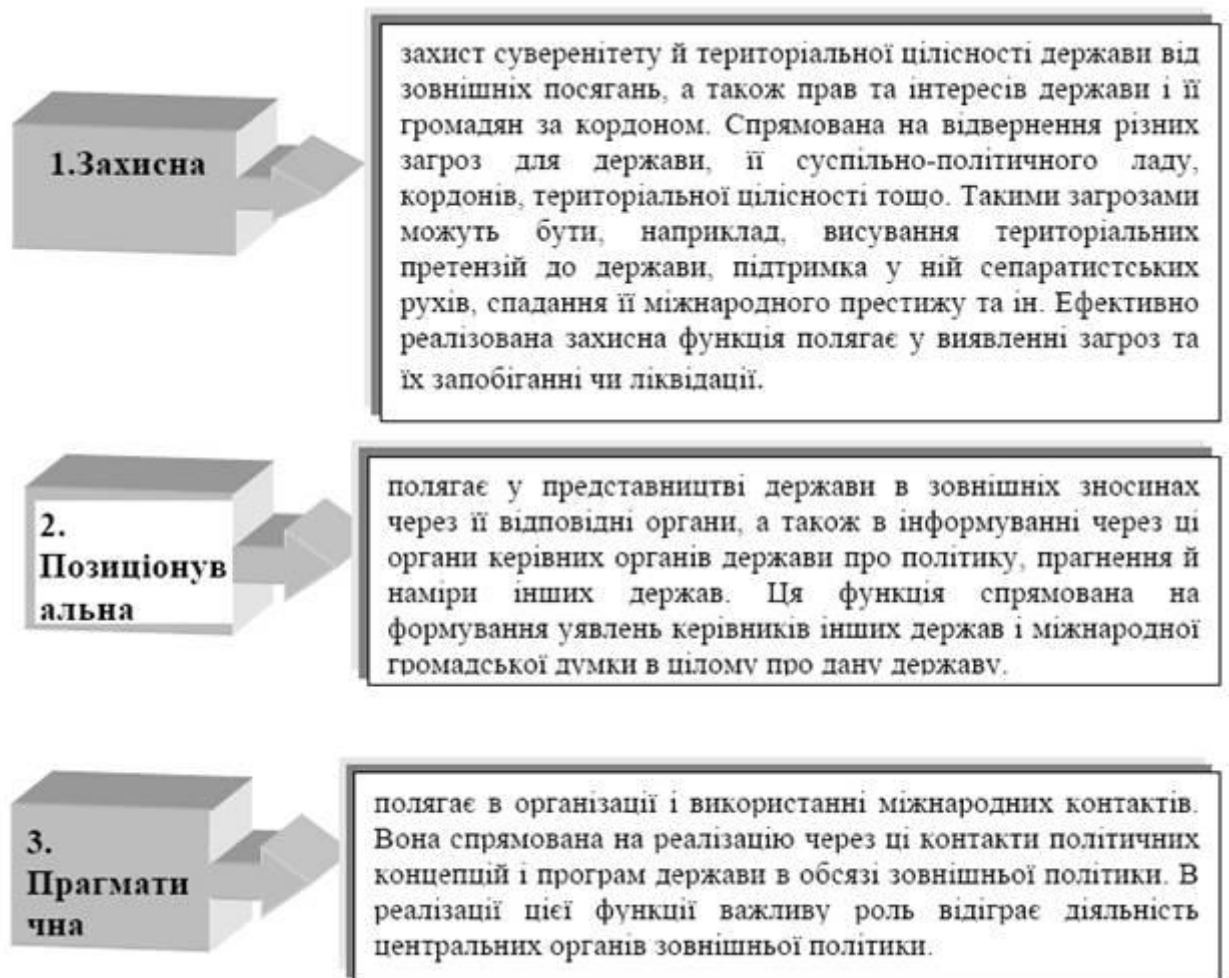
Рис. 1.2 Функції зовнішньої політики

Найважливішим способом здійснення функцій зовнішньої політики держави – це дипломатія , під якою розуміють контакти між державами і засоби їх реалізації (рис. 1.3).