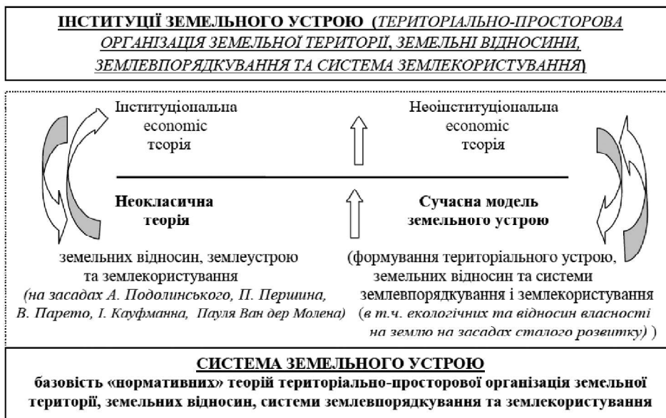
Рис. 2. Теоретичні складові зростання сутності земельного устрою від "Системи" до "Інституції" (гіпотеза дослідження)